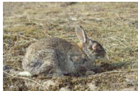
Myxomatose bij een wild konijn

In de kop van Noord Holland is er om de paar jaar een uitbraak in de duinen, waarbij er veel wilde (en tamme) konijnen sterven.