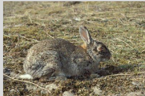
Myxomatose bij een wild konijn

In de kop van Noord Holland is er om de paar jaar een uitbraak in de duinen, waarbij er veel wilde (en tamme) konijnen sterven.