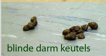
blinde darm keutels

Nachtkeutels zijn kleiner, donkerder van kleur en zacht. Normaal gesproken zie je nachtkeutels niet. Nachtkeutels komen uit de blinde darm van het konijn. Deze keutels bevatten heel veel bacteriën, naast vitamines en vetzuren die door de bacteriën gemaakt zijn uit de vezels. Hoewel dit misschien