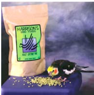
Valkparkiet met lifetime

Coarse is rijker aan vitamine en mineralen en vooral eiwitten, om het makkelijk te houden blijft de hoeveelheid voeding van lifetime wel gelijk. Is er geen lifetime gewicht aangegeven? Dan moet de vogel op Coarse blijven voor de rest van zijn/haar leven.