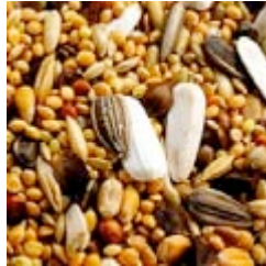
Zaadmengsel voor kleine papegaaien/ parkieten

De meeste van onze gezelschapsvogels, kanaries, parkieten en papegaaien krijgen een zaadmengsel te eten. Dit wordt in de dierenwinkel verkocht als complete voeding.