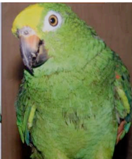
Zelfde vogel 9 maanden na pellets

Hier doen we het toch voor? Een vogel die vele malen gezonder is en dus een langere levensduur zal hebben om van ze te genieten.