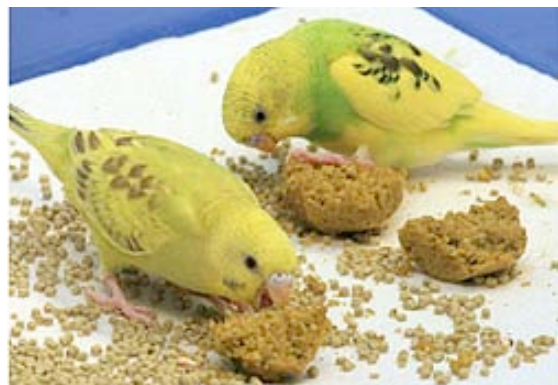
Grasparkieten slopen de zelfgemaakte koekjes en leren zo de smaak van Harrison kennen