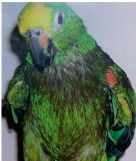
Amazone op Zaden mengsel

Bij twijfel overlegt u met uw dierenarts!!!