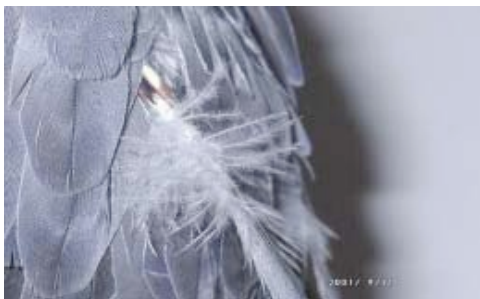
Een slecht verenkleed kan door slechte voeding maar ook door ziektes zoals Pbfd

Daarnaast kan slechte voeding een rol spelen bij het veren plukken.