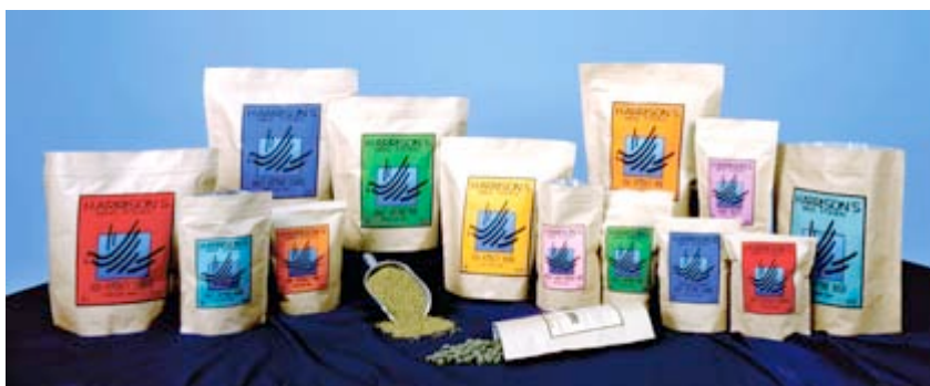
Er zijn verschillende soorten en maten Harrison's, waaronder 'tractatie snoepjes'

Meer info? Kijk op www.harrisonsbirdfoods.com