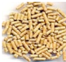
Pellets of korrel voor kippen

Gek genoeg voeren we onze kippen, patrijzen, fazanten, eenden en ganzen al jaren wel een complete voeding, namelijk een pelletvoer zoals van Teurlings, en niet alleen maar granen. Deze voeding bevat alles wat ze nodig hebben.