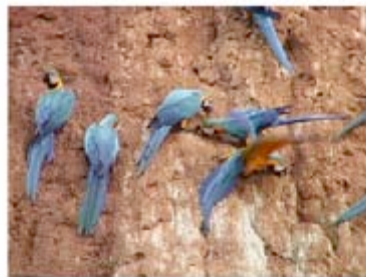
Blauwgele ara's eten mineralen

De zaden die wij voeren zijn gedroogd en dus eigenlijk al oud, en ze eten niet alle zaden op. De manier om een vitamine, eiwit of mineralen tekort te krijgen, en een vet overschot!!! Dit lijdt dan ook onherroepelijk tot ziektes, soms pas na enkele jaren!!!