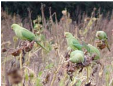
Halsbandparkieten op zonnebloemen

In de natuur eten deze vogels wel zaden, maar niet uitsluitend, vooral in de winter. Zo eten ze onder andere ook vruchten, groenten, verse boom- en bloemknoppen, insecten (larven), dode diertjes en kunnen ze mineralen uit de grond of het gebergte halen. De meeste van de zaden die ze eten zijn vers, en een tijdelijke deficiëntie wordt gecompenseerd door een goede periode een (paar) maanden later wanneer er weer een overschot is van andere voeding.