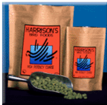
High potency coarse